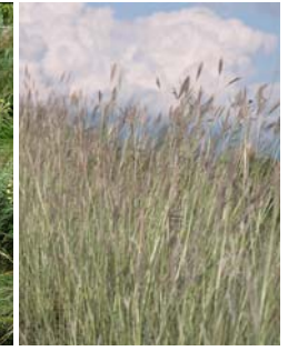
Pied de poule Bothriochloa ischaemum