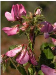
Bugrane à feuilles rondes Ononis rotundifolia