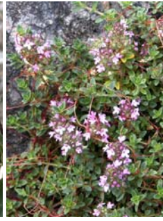
Thym précoce Thymus praecox