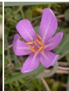
Colchique d'automne Colchicum autumnale