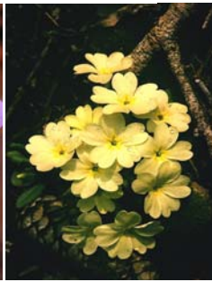
Primevère acaule Primula acaulis