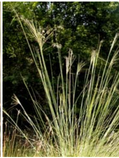
Stipe chevelue Stipa capillata