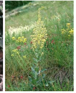
Molène lychnite Verbascum lychnitis