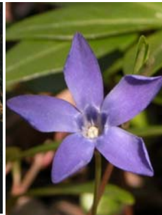
Petite pervenche Vinca minor