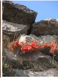
Ephédre de Suisse (fruits) Ephedra helvetica