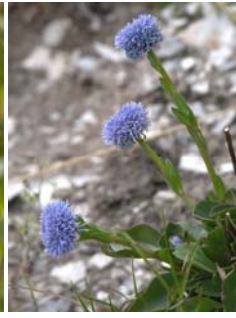
Globulaire allongée Globularia punctata