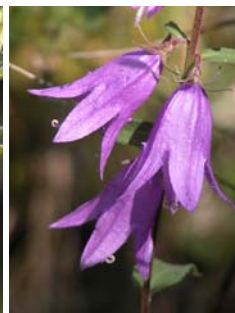
Campanule stolonifère Campanula rapunculoides