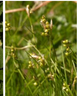
Laiche blanche Carex alba