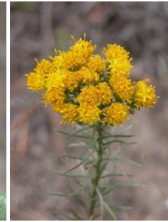
Aster linoxyris Aster linoxyris