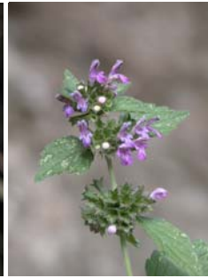
Ballote noire Ballota nigra