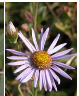
Aster amelle Aster amellus