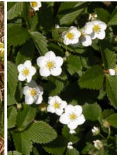
Fraisier des bois Fragaria vesca