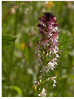
Orchis brûlé Orchis ustulata