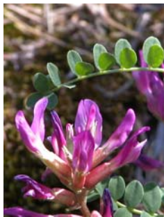
Astragale de Montpellier Astragalus monspessulanus