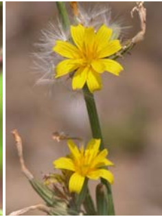
Chondrille à tige de jonc Chondrilla juncea