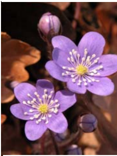
Hépatique à trois lobes Hepatica nobilis