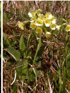
Primevère élevée Primula elatior