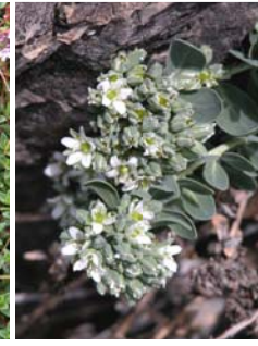
Téléphium d'Impérato Telephium imperati