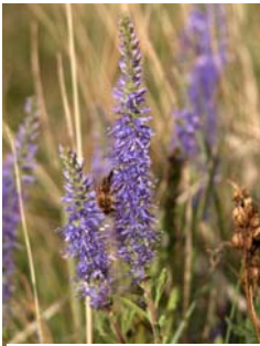
Véronique en épi Veronica spicata