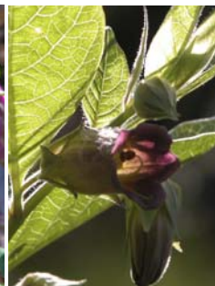
Belladone Atropa belladonna