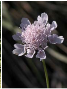
Scabieuse à trois étamines Scabiosa triandra