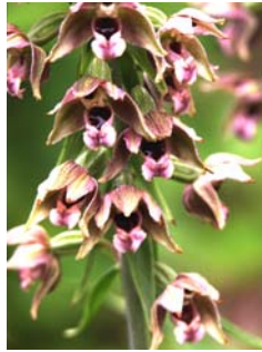
Epipactis à larges feuilles Epipactis helleborine