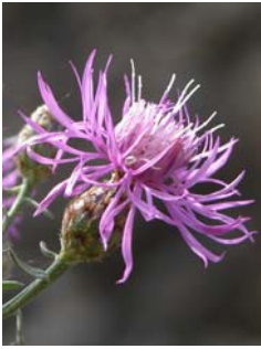
Centaurée du Valais Centaurea valesiaca