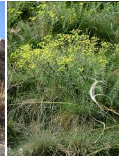
Euphorbe de Séguier Euphorbia seguieriana