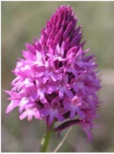
Orchis pyramidal Anacamptis pyramidalis