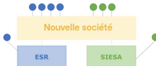
Fig. 5 – Scénario sub-optimal

Malgré cette situation, et pour autant que les deux tiers au moins des voix attribuées aux actions représentées à l'assemblée générale des sociétés qui participent à l'opération et la majorité absolue des valeurs nominales des actions représentées, la fusion par absorption des sociétés esr et Siesa reste possible. Celle-ci s'opère toutefois par le biais des règles « ordinaires » (par opposition aux règles « simplifiées ») prévues dans la LFus ce qui implique