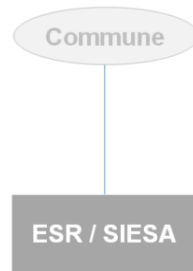
Fig. 1 - Situation actuelle