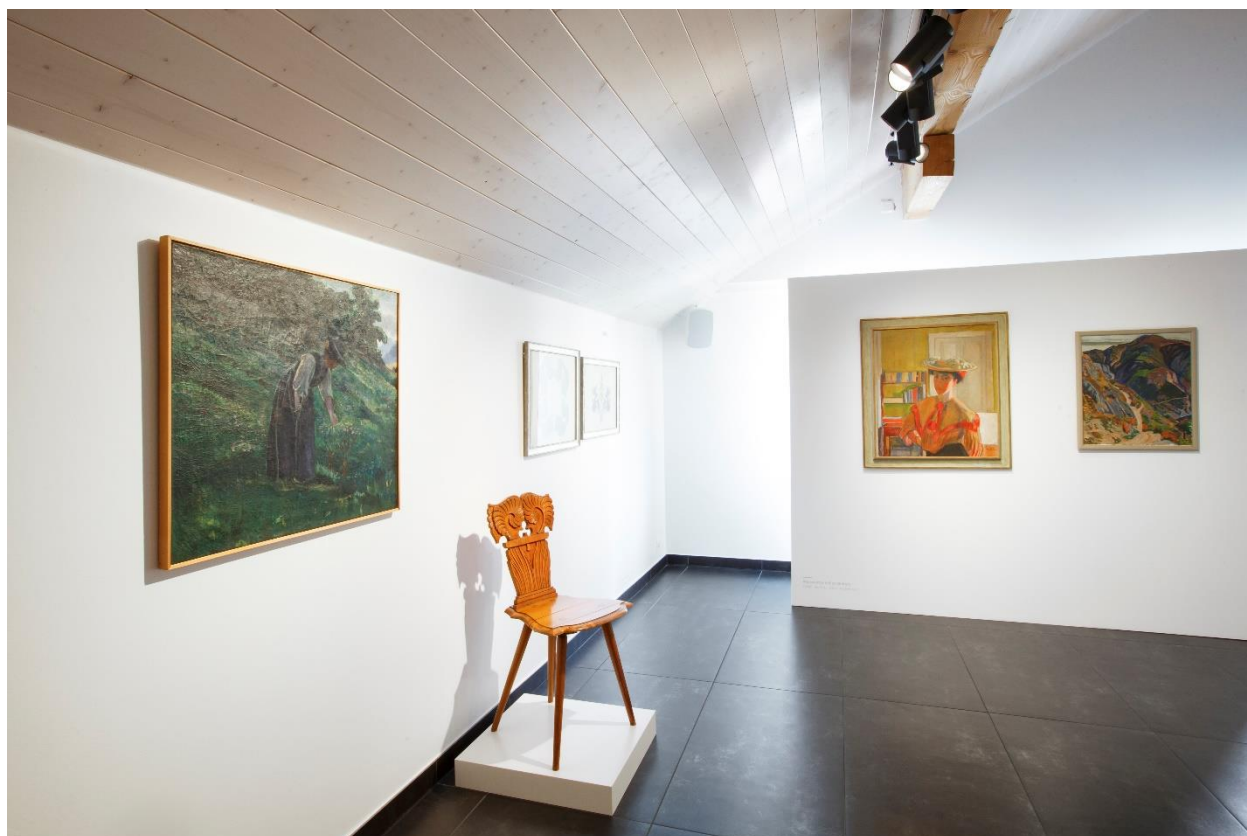
Vue de la nouvelle temporaire focus École de Savièse et artistes (re)connues 03.09.2022 > 30.07.2023